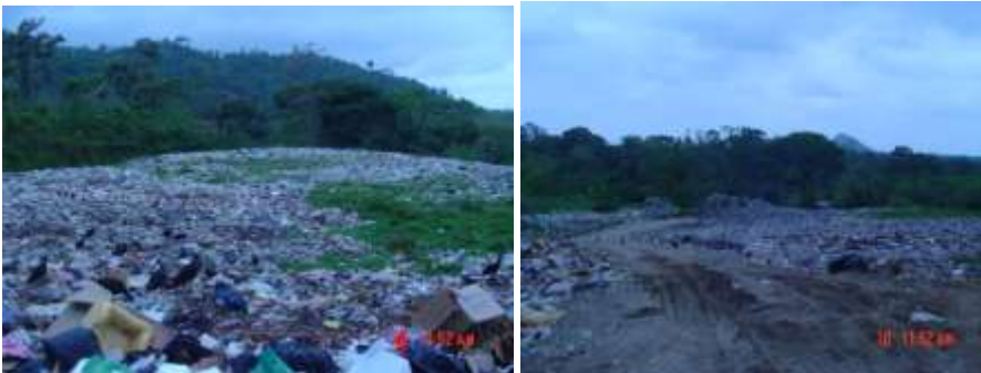
FOTOS No. 12 Del Relleno Sanitario