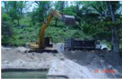
FOTOS No. 3 Situación de la microcuencas de Río Bañaderos