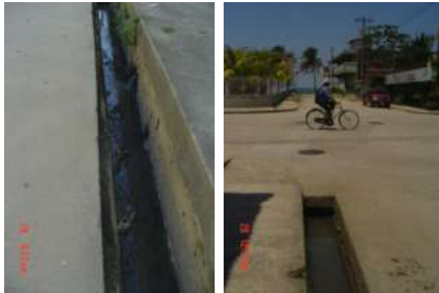
FOTOS No. 1 Disposición de Aguas Pluviales del Municipio de Tela