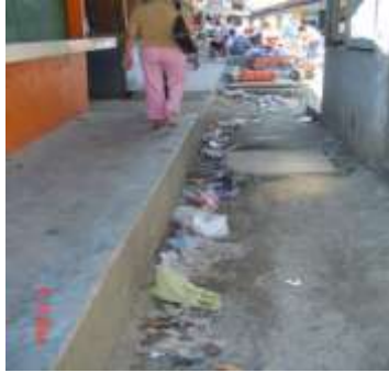
FOTOS No. 4 Basura en lugares inadecuados en el Mercado Municipal de Tela