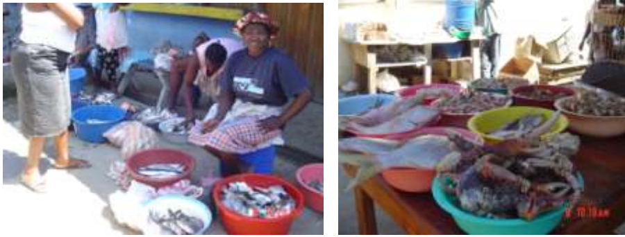
FOTOS No. 7 Disposición de mariscos en el Mercado Municipal