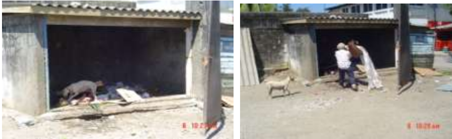
FOTOS No. 5 Sitio de disposición temporal de los desechos en el Mercado Municipal