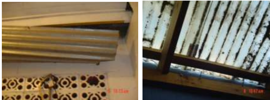
FOTOS No. 6 Condiciones del techo del Mercado Municipal