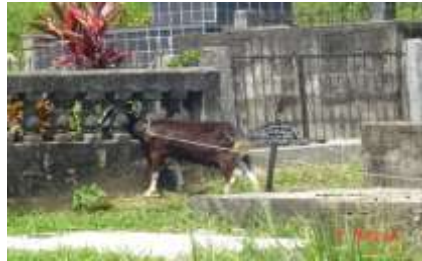
FOTOS No. 9 Parte del Cementerio Municipal sin cerco perimetral