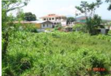
FOTOS No. 8 Condiciones de limpieza del Cementerio Municipal