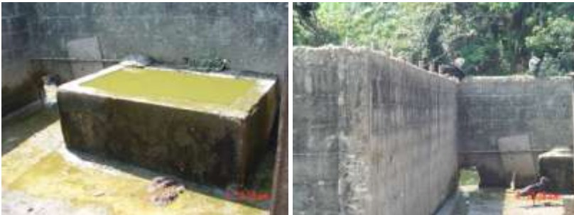
FOTOS No. 13 De los desechos líquidos del Rastro Municipal