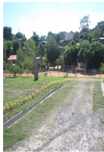
MODULO CERRADO I