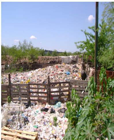
ASENTAMIENTOS – VERTEDEROS CLANDESTINOS

OBSEVACIÓN N° 11: Vecinos del lugar con pequeños vertederos en sus patios, al lado de la laguna Cateura. Al costado de la vía de ingreso al vertedero, que bordea el mismo, se observan canales con agua colmados de residuos.