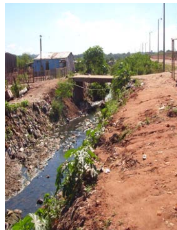
CURSOS DE AGUA CON RESIDUOS