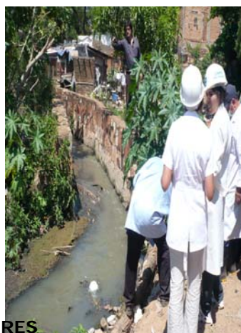
LAGUNA CATEURA Y SUS ALREDEDORES