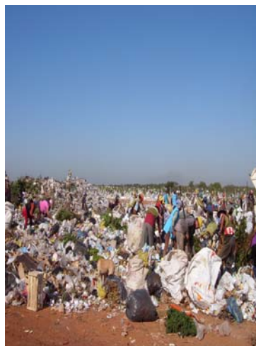
AREA DE SEGREGACIÓN