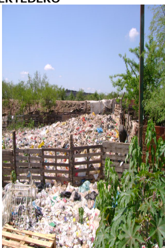
ALREDEDORES DE LA LAGUNA CATEURA