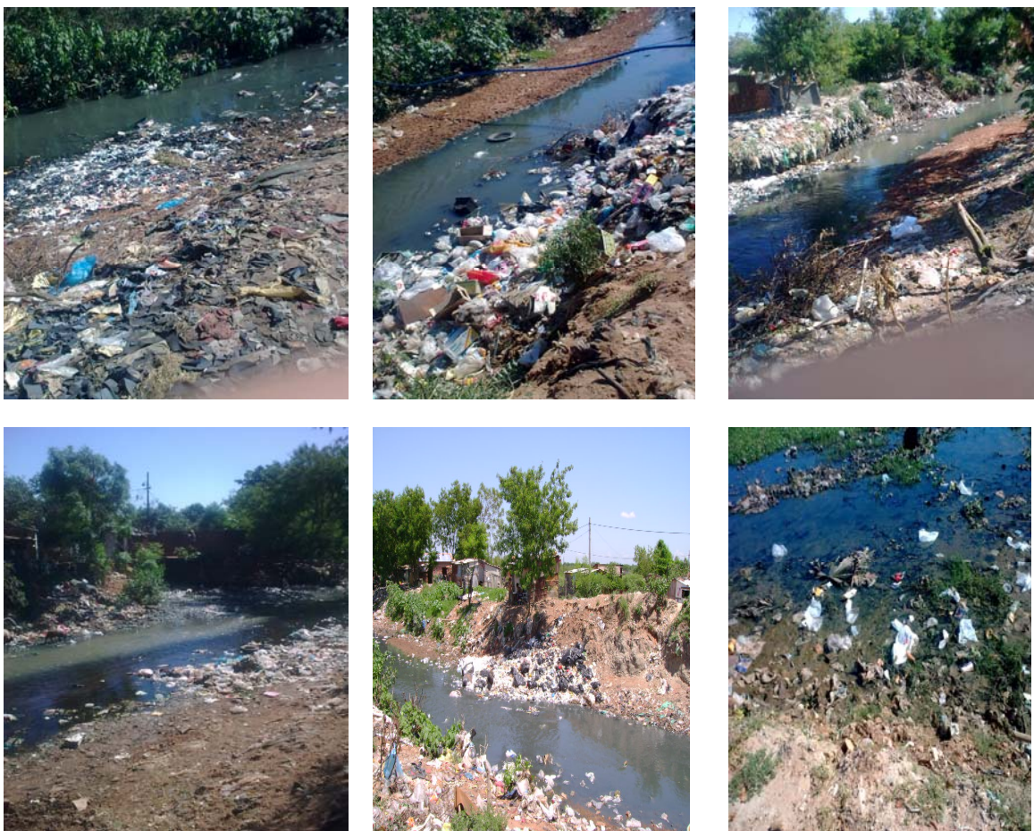
CURSO DEL ARROYO FERREIRA

Toda la zona observada del Arroyo Ferreira se encuentra en una situación de degradación grave, el arroyo contaminado por descargas cloacales y vertido de basura. La población aledaña vive en condiciones alarmantes de insalubridad.