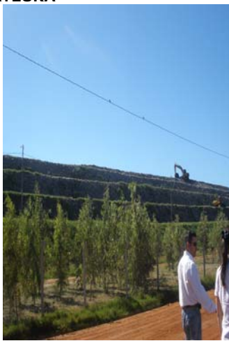
MÓDULO DE DISPOS. FINAL