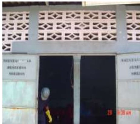
Imagen No. 7

Sitio de almacenamiento temporal cerca del área de cocina.