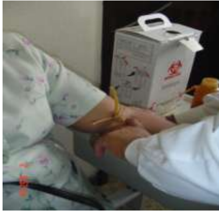
Imagen No. 9

Personal que trabaja en el área de laboratorio sin usar equipo de protección.