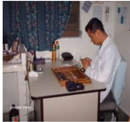
Imagen No. 11

Personal que trabaja en el área de laboratorio sin usar equipo de protección.