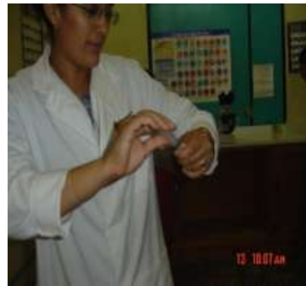
Imagen No. 6

Personal que labora en hospital Santa Rosita no utiliza guantes ni la técnica de una sola mano al momento de descartar jeringas.