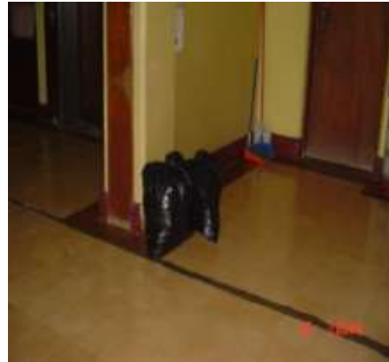
Imagen No. 8

Sitios de acumulación de los desechos previo a su transporte hasta el sitio de disposición final.