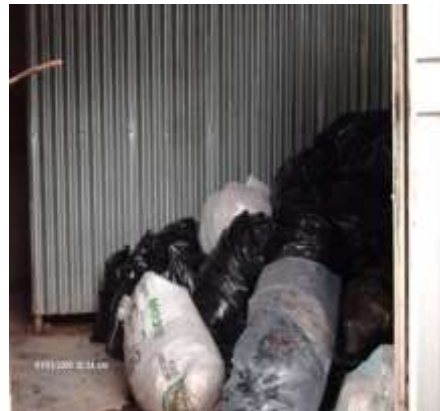
Imagen No. 9

Lamina de metal indicando la separación que tiene el área de almacenamiento temporal de los desechos.