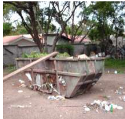
Imagen No.2 Deposito para recolección de maleza.