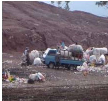
Imagen No. 2

Sitio de disposición final nuevo utilizado como botadero de desechos.