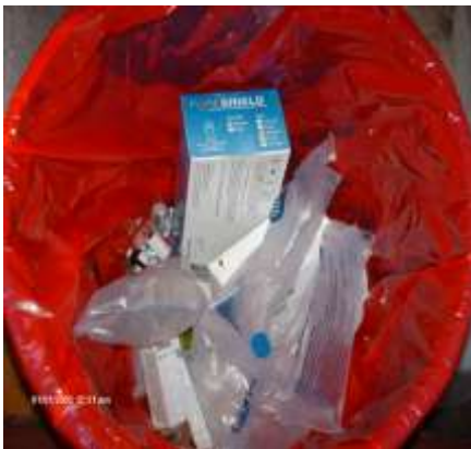
Imagen No. 1 Cajas de cartón dentro de recipientes para desechos peligrosos.