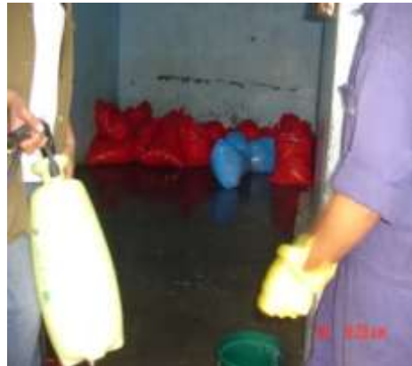
Imagen No. 4

Bolsas de desechos peligrosos sin etiquetarse