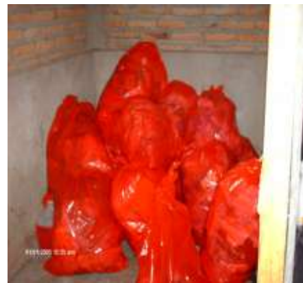
Imagen No. 7

Recipiente para desechos cortopunzantes utilizado para el lavado de vehículos.