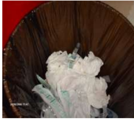
Imagen No. 2

Guantes y jeringas colocados en recipientes para desechos comunes.