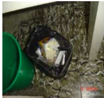
Imagen No.1 Recipientes de cocina sin bolsas para depositar los desechos.