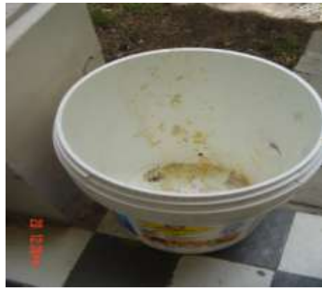
Imagen No. 2

Gasas, papel y cajas de productos dentro de bolsas rojas