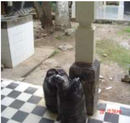
Imagen No. 3

Recipiente para depositar los desechos sin bolsa