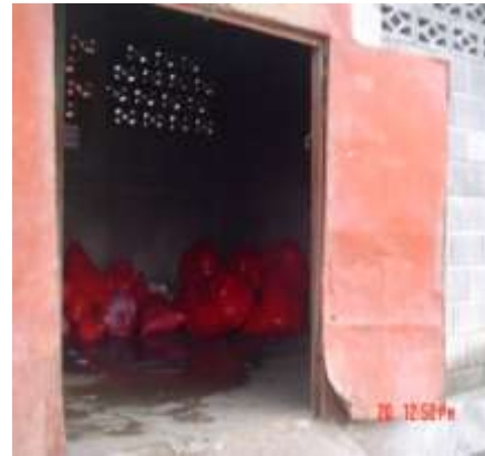
Imagen No. 7

Puerta del sitio de almacenamiento temporal en mal estado y sin seguridad