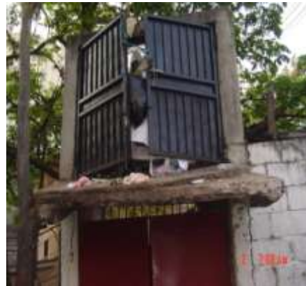
Imagen No. 6

Sitio de almacenamiento temporal no cuenta con símbolos que adviertan su peligrosidad.