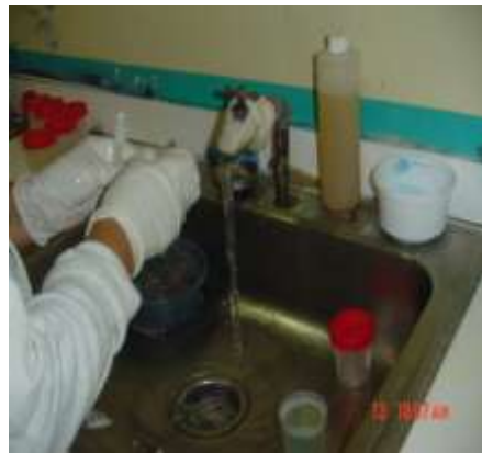
Imagen No. 2 Líquidos (sangre) en el área de laboratorio son desechados en el sistema de alcantarillado del hospital.