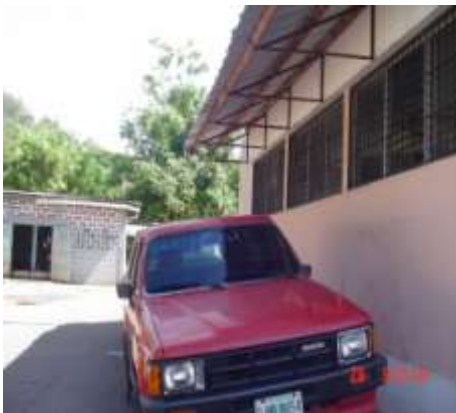
Imagen No. 6

Sitios de acumulación de los desechos previo a su transporte hasta el sitio de disposición final.