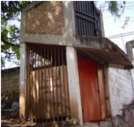
Imagen No.2 Acumulación de botes en área de lavandería provenientes de laboratorio.