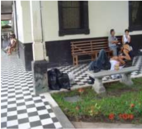
Imagen No. 4

Sitios de acumulación de los desechos previo a su transporte hasta el sitio de disposición final.