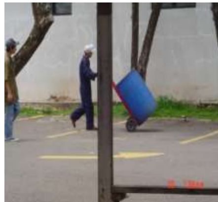
Imagen No. 5

Barriles plásticos donde se depositan y transportan los desechos al sitio de disposición final.