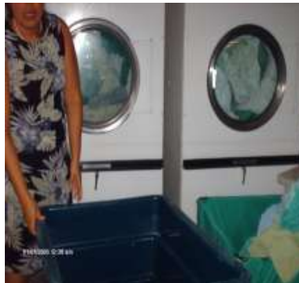
Imagen No. 12

Personal que trabaja en el área de laboratorio sin usar equipo de protección.