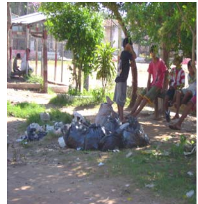
Residuos en la calle