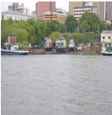
Astillero en la Bahía

Con relación al requerimiento a la Municipalidad, sobre las acciones de protección ambiental, a fin de mitigar el acceso de residuos de todo tipo al cuerpo de agua de la Bahía, el ente responde que la protección del cuerpo de agua de la Bahía depende de la protección de los cursos de agua y desagües pluviales que desembocan en ella, que dichas actividades dependen de la ESSAP y que la Municipalidad realiza controles periódicos mediante recorridos en la zona, atendiendo las normativas vigentes que regulan el control ambiental del Banco San Miguel, que son las Ordenanzas Nros. 143/00, 194/01 y 73/03.