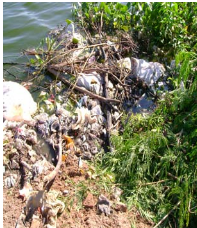
Riberas de lagunas