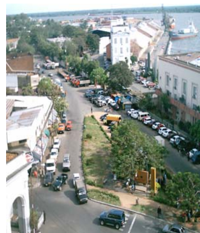
Circulación de vehículos entorno de la Bahía

Al realizarse la auditoría en el marco de la Resolución N° 512/06, la ANNP se encontraba elaborando un Manual de Gestión Ambiental para la ejecución del Plan de Gestión Ambiental, pero indicó que como las actividades no estaban incluidas en el presupuesto, las mismas no podrían ser implementadas. A la solicitud de las fiscalizaciones realizadas al respecto, la SEAM no presentó ningún acta que compruebe una actividad del control. Se debe tener en cuenta que las actividades propias de la ANNP son altamente contaminantes con el agravante de que la misma se encuentra en un área de reserva.