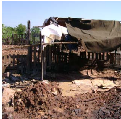
Aspecto de porqueriza