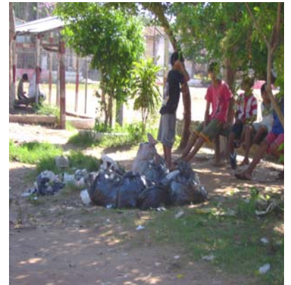
Residuos en la calle

Siguiendo con las inspecciones, el 30 de mayo de 2007 se realizó el recorrido por la Bahía durante el cual también se constató la presencia de varias actividades no compatibles con la zona, como astilleros, industrias (caleras, fábrica de cueros), viviendas que depositan sus residuos al pie de la Bahía, instituciones como la Administración Nacional de Navegación y Puertos (ANNP), que ejercen una fuerte presión sobre la Bahía a través de las actividades propias del ente.