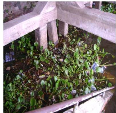
Muelle en la Bahía

Asimismo, a través de la nota D.M.A. N° 511, de la Dirección de Medio Ambiente, la Municipalidad de Asunción informa que realiza la limpieza de los canales y cursos de agua que desembocan en la Bahía y la ribera del río periódicamente, una vez por año, antes de la temporada veraniega, además de intervenciones puntuales sobre denuncias de vertido de aguas servidas, rellenos, criadero de chanchos, quema de huesos, vertederos clandestinos, curtiembres y frigoríficos.