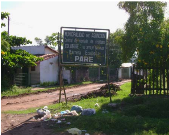
Banco San Miguel

Examen Especial a la gestión de la Secretaría del Ambiente (SEAM) y la Municipalidad de Asunción, con relación a la situación ambiental de la Bahía de Asunción y el Banco San Miguel.