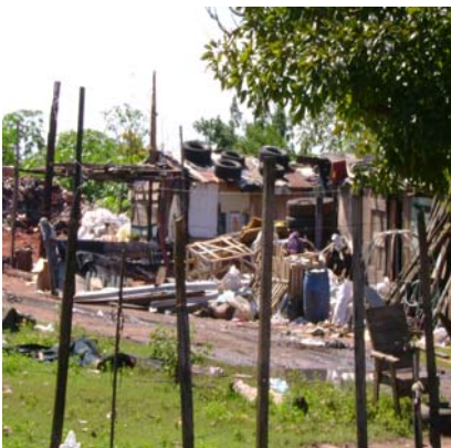
Vivienda en el vertedero

Las actividades de control son escasas y aisladas, complementarias a las soluciones de fondo de la problemática, que deberían tomar en cuenta la situación socio-económica y ambiental que aqueja al lugar.