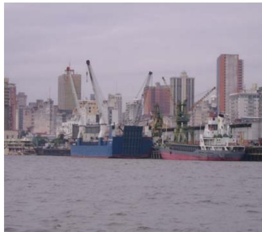
Bahía de Asunción