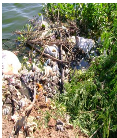
Riberas de lagunas cercanas a las viviendas