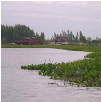
Astillero en la Bahía