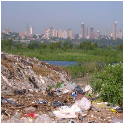
Vertederos de desechos – Banco San Miguel

Nuestra Misión: Ejercer el control de los recursos y del patrimonio del Estado mediante una eficiente y transparente gestión.