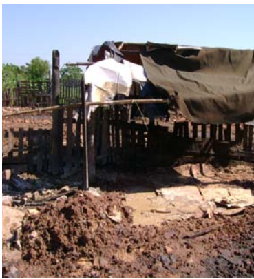
Porqueriza – Banco San Miguel