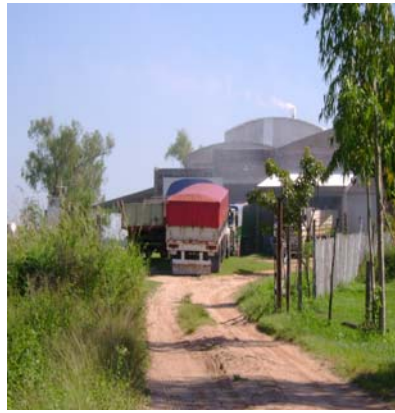
La empresa calera Zucal