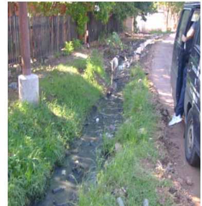
Canales a cielo abierto

La Ley N° 1294/87 "Orgánica Municipal" establece como funciones municipales: "...ñ) La preservación del medio ambiente y el equilibrio ecológico, la creación de parques y reservas forestales, promoción y cooperación para proteger los recursos naturales... o) El fomento de la salud pública, la construcción de viviendas de carácter social y programas de bienestar de la población".