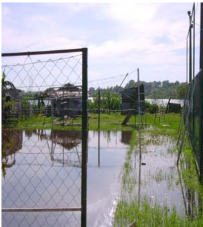
Precarias viviendas inundadas

De acuerdo a la verificación in situ , en el lugar se desarrollan actividades incompatibles con un área de reserva y no se observaron resultados de las actividades de protección ambiental realizadas por la Secretaría del Ambiente en el área.