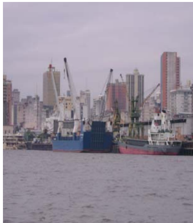
Grandes embarcaciones en la Bahía

Según el dictamen de la DGPCRH, en el EIA la descripción del medio físico es bastante limitada y no relaciona claramente la interacción suelo, agua, biodiversidad, relaciones con la Bahía, entre otros, y solicita datos acerca del pozo utilizado para las actividades de la ANNP.