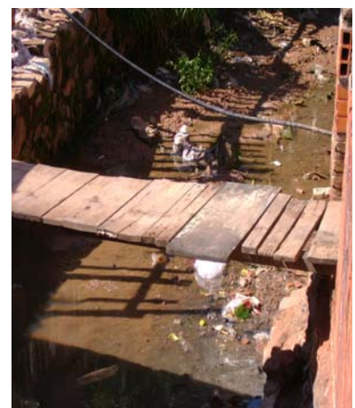
Cursos de agua con residuos