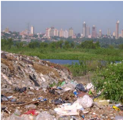
Residuos en el patio de una vivienda