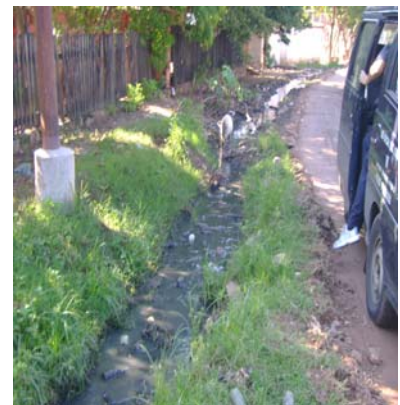
Canales a cielo abierto