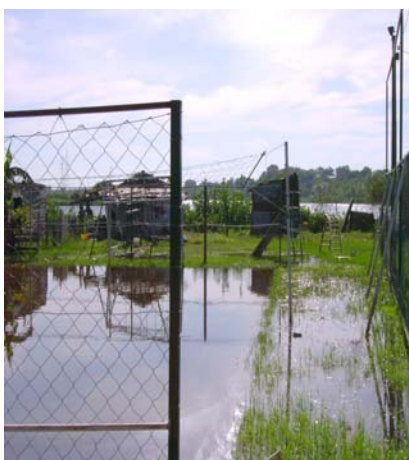
Precarias viviendas inundadas

En la oportunidad, el recorrido se realizó en la zona del Banco San Miguel, donde se evidenciaron varias situaciones altamente contaminantes al ambiente y a la salud humana: