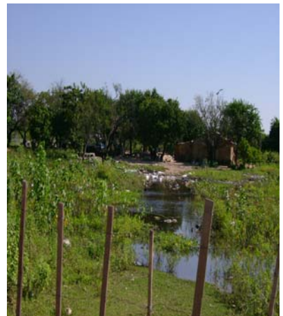
Cursos de agua con residuos

El 17 de abril de 2007 se inician las verificaciones físicas, a fin de corroborar la situación actual de la zona bajo estudio.